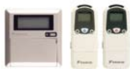
MERCA WRC COA-HPA